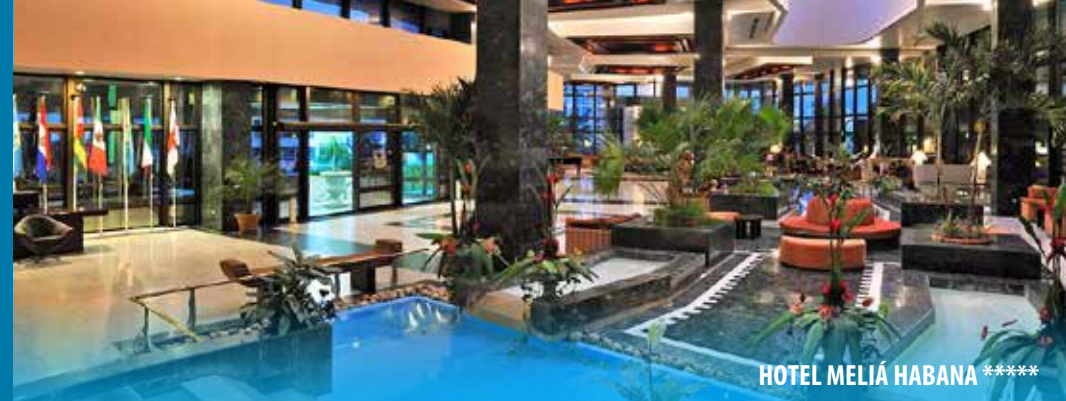
HOTEL MELIÁ HABANA *****