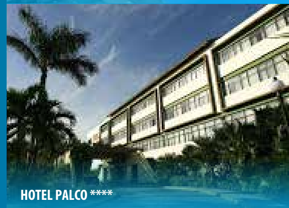
HOTEL PALCO ****