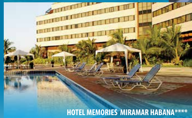
HOTEL MEMORIES MIRAMAR HABANA****