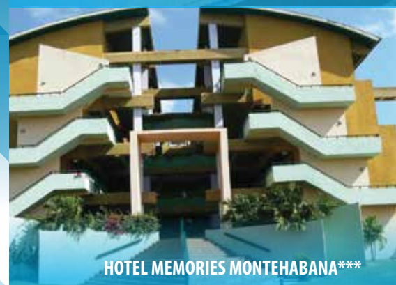
HOTEL MEMORIES MONTEHABANA***